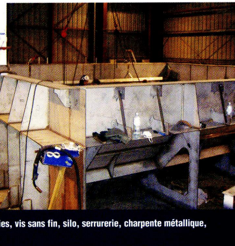
Timolor dispose de nombreuses références pour la réalisation de pièces industrielles : trémies, vis sans fin, silo, serrurerie, charpente métallique, ensemble mécano-soudé...

Créée en 1985, Timolor s'est développée autour des métiers de la construction et de la réparation navale. Regroupant les activités du groupe Leroux & Lotz, la société emploie 140 à 160 salariés, dont 40 à 50 sur son agence nazairienne et s'est ouverte sur l'industrie. A Lorient, sur le port de Keroman, elle s'organise en domaines d'activités stratégiques (DAS) : ingénierie (maîtrise d'œuvre multispécialités et développement), grands comptes (DCN Lorient, Brest, Cherbourg et Toulon - Aker Yards France à Saint-Nazaire et Lorient) ; construction et réparation navale ; industrie (réalisation, montage, maintenance, démantèlement et transfert d'usine).